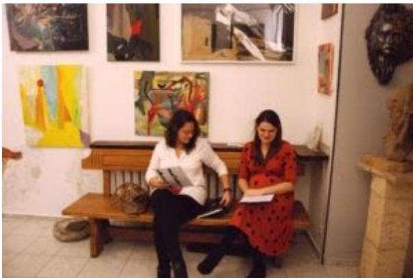
Wystawa Malarstwa Galeria Szalom Wernisaż 2020

Indywidualna Wystawa Malarstwa w najstarszej Galerii na krakowskim Kazimierzu Galeria Szalom, Kraków