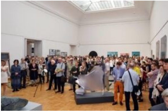
Zbiorowa wystawa wybranych prac dyplomowych ASP 2017