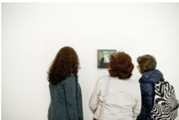
Zbiorowa wystawa podczas III Edycji Krakow Photo Fringe „Bohater pod ręką” 2015